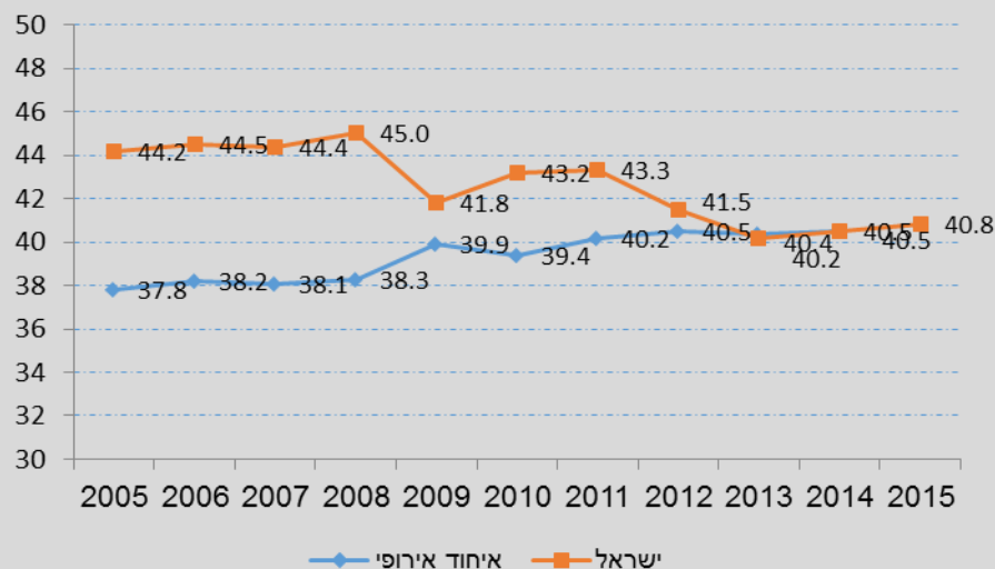
השתתפות הממשלה בסך מקורות מימון הביטחון הסוציאלי - ישראל והאיחוד האירופי (אחוזים), 2005-2015

ברוב מדינות האיחוד האירופי יש מימון מעורב של המדינה (מיסים) ושל המבוטחים (דמי ביטוח), אך יש הבדלים ניכרים בין המדינות במבנה המימון: במדינות אנגלוסקסיות (כגון אירלנד ואנגליה), וסוציאל-דמוקרטיות (כגון דנמרק ושוודיה), רוב המימון מבוסס על השתתפות הממשלה – 60%-80% מסך התקבולים; ובמדינות קורפורטיסטיות (כגון גרמניה, צרפת, בלגיה ושווייץ) רוב המימון מבוסס על דמי הביטוח ולכן השתתפות המדינה נמוכה במיוחד – 20%-40% מסך התקבולים.