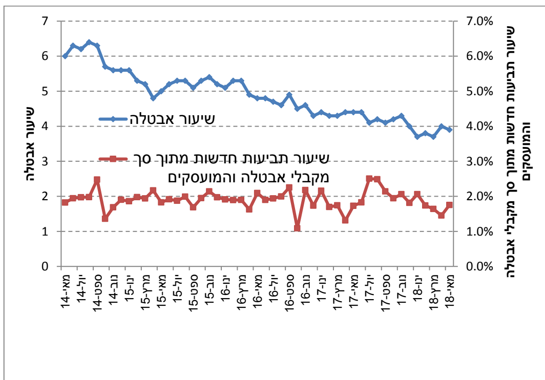
תרשים 2: שיעור תביעות חדשות לדמי אבטלה מתוך סך המועסקים וסך מקבלי דמי אבטלה בהשוואה לשיעור האבטלה

*נתוני הלמ"ס – שיעור האבטלה ומספר הבלתי מועסקים מתייחסים לחודש הקודם.